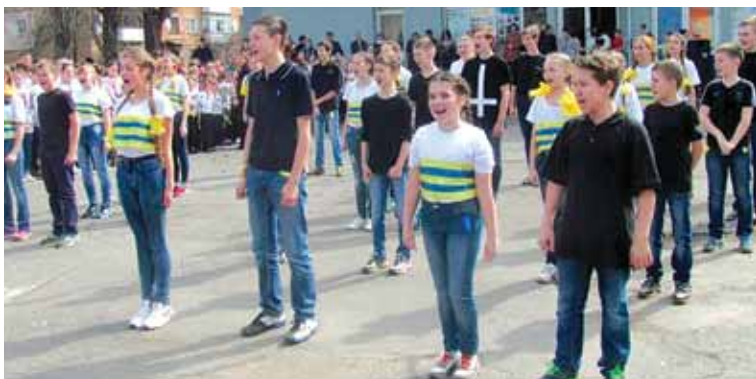
Школа № 1 — найоригінальніша

Від глядачів хочу передати велику подяку організаторам цього прекрасного дійства. А міському відділу культури — вимогу: почати працювати.