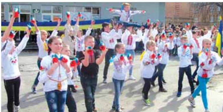
Школа № 2 — найкраща