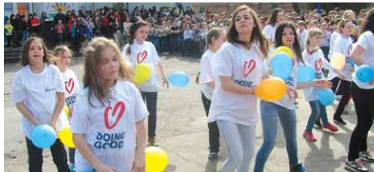
Школа № 6 — найзгуртованіша