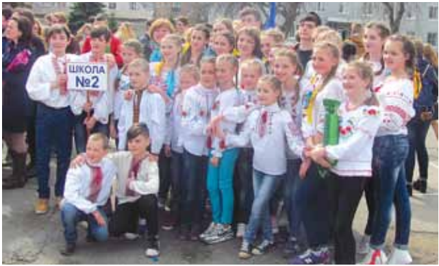
ЗМАГАЛАСЯ МОЛОДЬ СЬОГОДЕННЯ. ПЕРЕМОГЛА ШК. №2