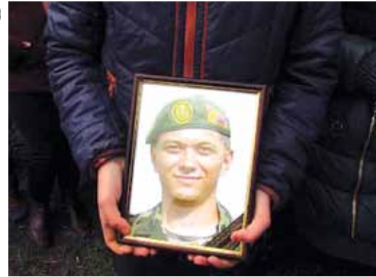
ВОІНА ПОХОРОНИЛИ ЧЕРЕЗ ПІВТОРА РОКУ