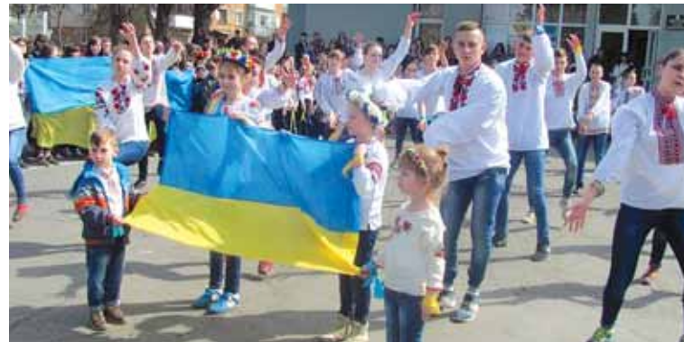
Команда професійного училища залізничного транспорту — найпатріотичніша