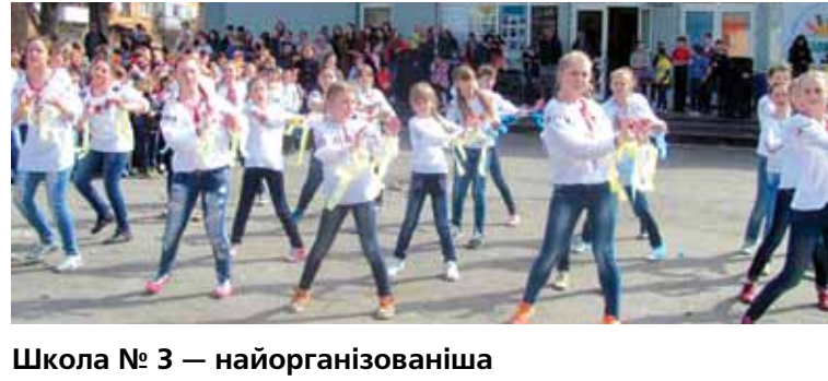
Школа № 3 — найорганізованіша