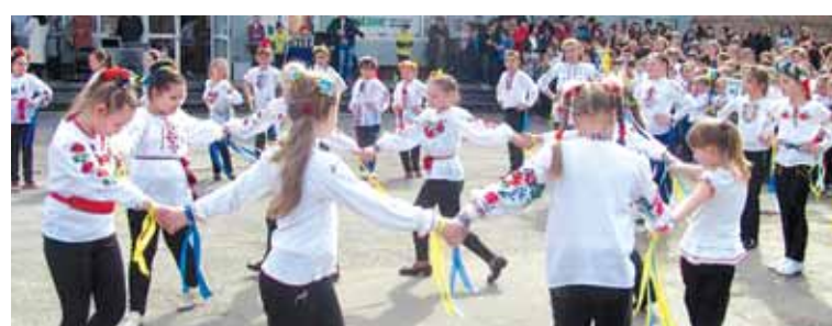
Школа № 5 — найемоційніша.