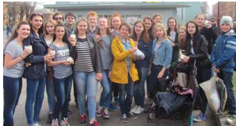
Школа-ліцей — найкреативніша