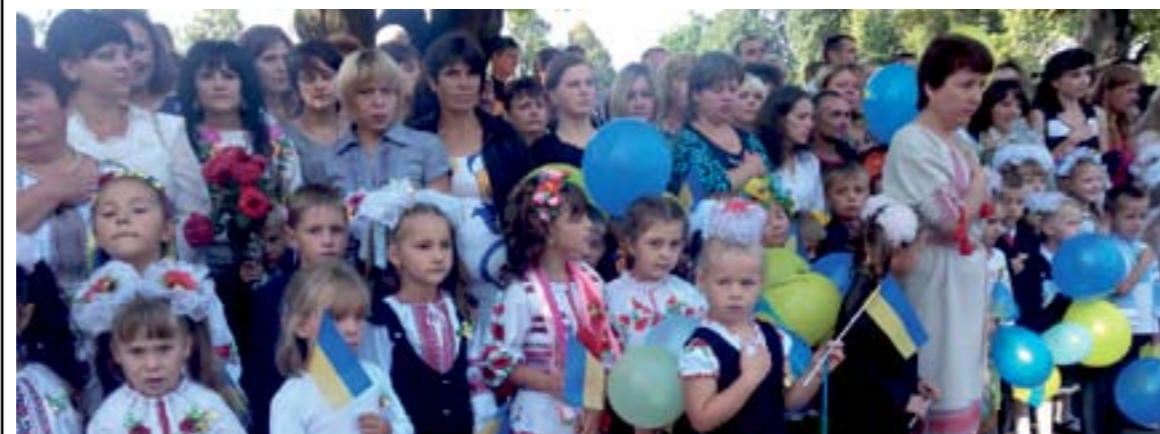
Першокласниці були, як квіточки, у вишиванках