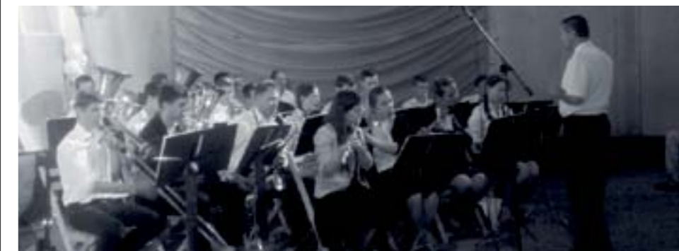
Оркестр церкви «Скінія» виконав більше десяти духовних творів

Молимося, щоб біля кожного військового був ангел-охоронитель