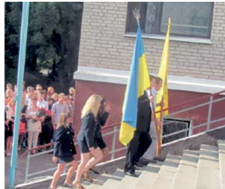
Внесення прапорів України та училища було урочистим

Лінійка проходила під музичні акомпанементи Миколи