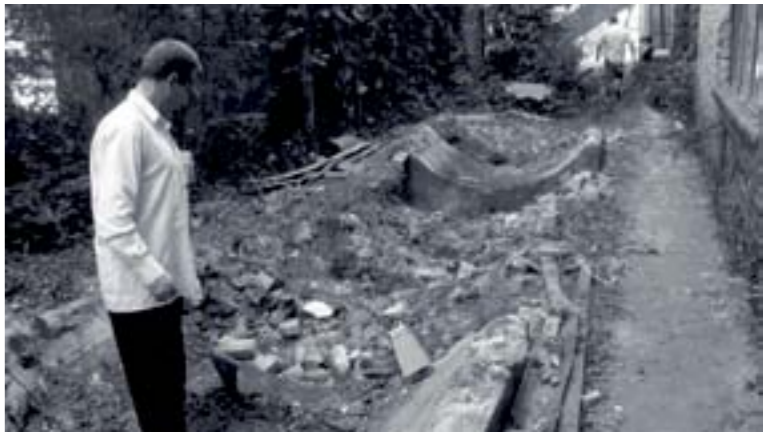
Саме тут була 12-тонна цистерна

З того часу кворум знову не може зібратися і, мабуть, вже не збереться. І сесія так ніколи і не отримає ніякої інформації. До речі,