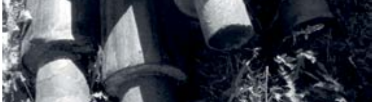
Ці труби чомусь теж не передані виконавчому комітету

Надто потужні сили і в чиновницьких кабінетах, і в депутатському корпусі зацікавлені в протилежному.