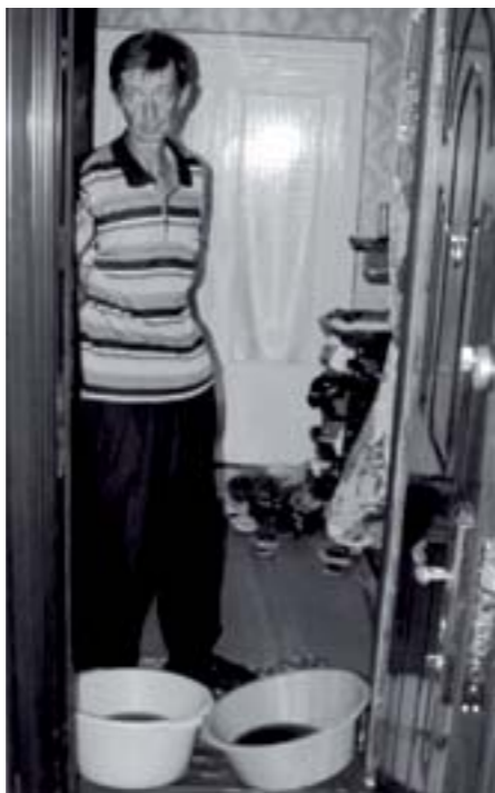
У мешканців миски напоготові

Секретарка комунального підприємства мусить казати неправду журналістам, що горе-керівник відсутній. Тому що той не хоче нічого коментувати. Сам