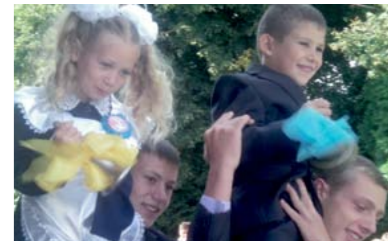
Перший дзвінок в Жежелівській школі