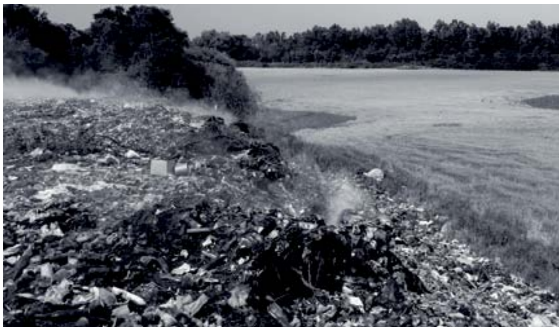
Козятинський полігон твердих побутових відходів межує з орними землями

З другого боку створено горе-полігон, який є бомбою уповільненої дії для нас усіх. Зрозуміло,