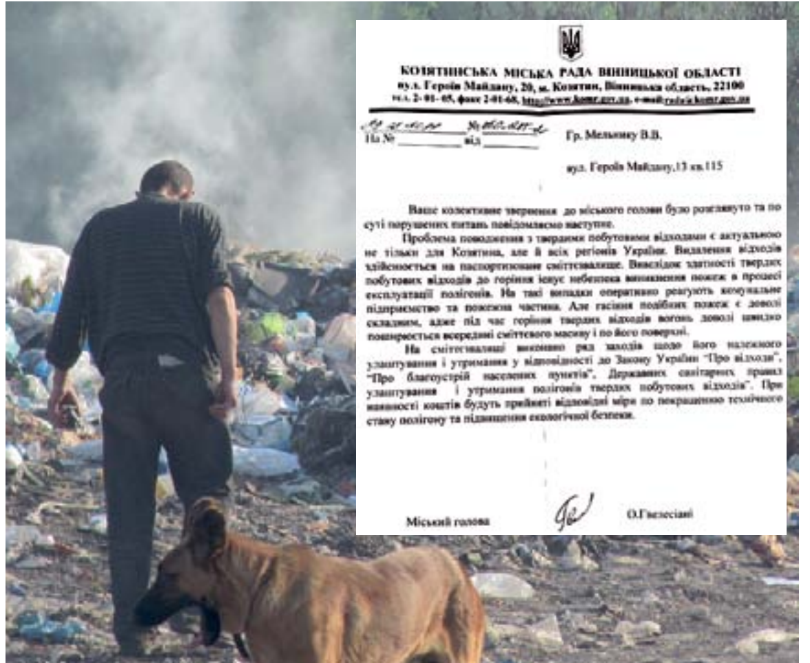
Густий дим над козятинським полігоном твердих побутових відходів Фото 2 зверху праворуч: Відповідь міського голови на звернення громадян

Як бачимо з листа, полігон гасять завжди "оперативно". Але це не відповідає дійсності. Ніхто не реагує на те, що місто весь час покрито смогом. До речі, відповідно до існуючих норм, подібні полігони при температурі повітря вище 25 гр. С мають проливатись водою з розрахунку 10 л на 1 куб. м ТПВ.